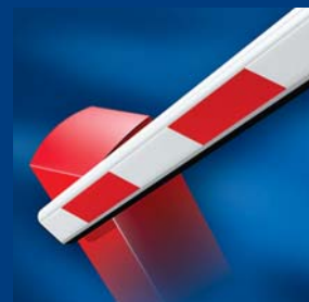
tousek szlabany drogowe atrakcyjne i niezawodne

Zastrzegamy sobie prawo do zmian; za ewentualne błędy w druku nie ponosimy odpowiedzialności.