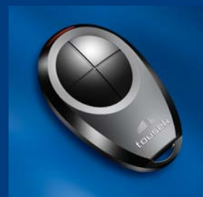
tousek program nadajników impulsów kompatybilne i niezawodne