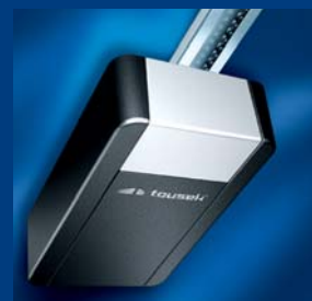
tousek napędy do bram garażowych szybkie i oszczędne