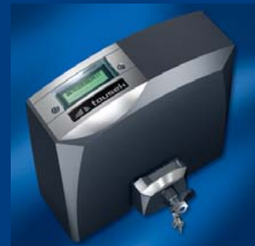
tousek napędy do bram przesuwnych kompaktowe i niezawodne